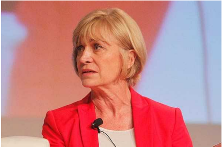
Matthei contra reforma laboral: "Es un desastre y peor que la tributaria"