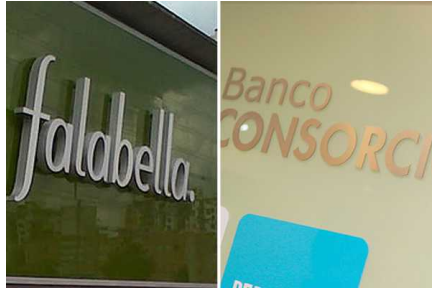
Sernac interpone demandas colectivas contra Falabella y Banco Consorcio