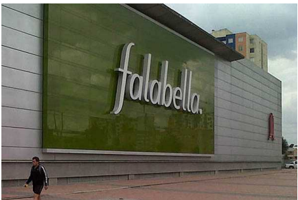
Falabella responde a acusación del Sernac: "Nunca se publicó una oferta de tablets a $5.990"