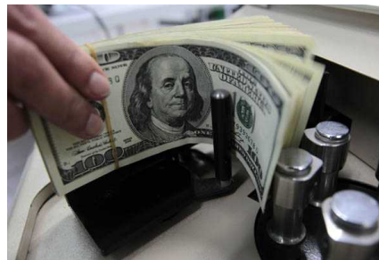
Dólar se desploma tras datos de empleo en EE.UU. y llega a su menor nivel en un mes