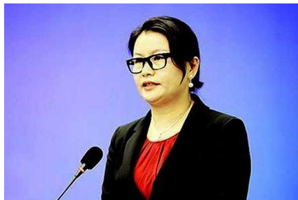
Presidenta de firma que provee a Apple se transforma en la mujer más rica de China