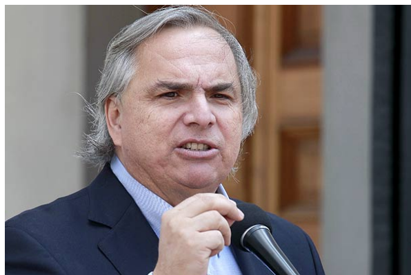
Chadwick descartó que el Gobierno tenga "mano dura" con los estudiantes durante las marchas.

Emol Martes, 11 de Octubre de 2011, 11:16