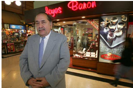
Condenan a dueño de Joyerías Barón a 5 años de libertad vigilada por delito tributario