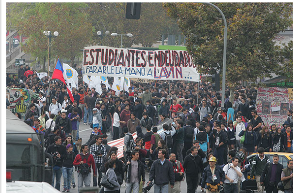
Los estudiantes se reunieron en Plaza Italia y marchan hacia la plaza Almagro (Foto de archivo).

SANTIAGO.- Con más de diez mil adherentes, esta mañana se inició la multitudinaria marcha convocada por la Confederación de Estudiantes de Chile (Confech) para exigir mejoras a la educación superior.