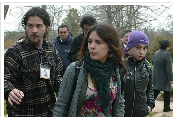
Los universitarios debieron entregar la contrapropuesta al jefe de gabinete del ministro.