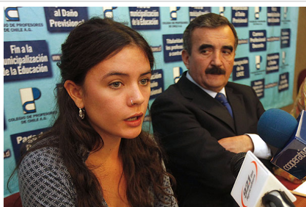
Camila Vallejo sostuvo que el movimiento no es sólo estudiantil sino de todos los actores sociales.