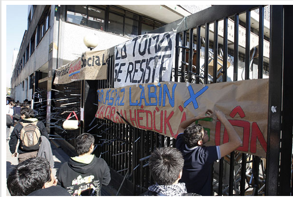
Decenas de nuevos colegios fueron tomados por los estudiantes en esta jornada de movilización.