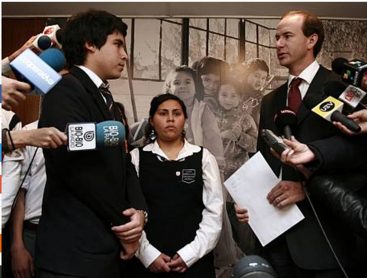
El presidente de la Femes le entrega la carta al subsecretario de Educación.