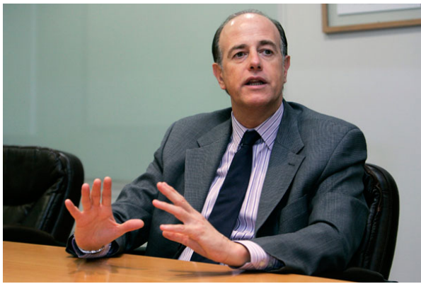
Archivo.