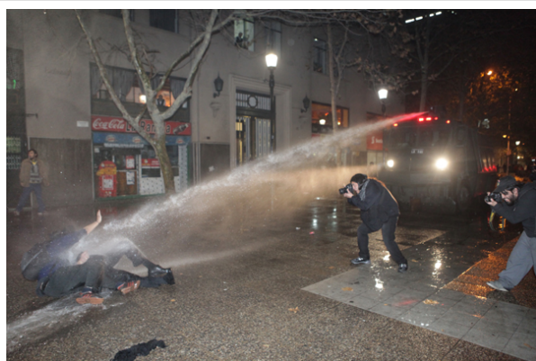
Manifestantes de diversas ciudades del país protestaron por la aprobación de HidroAysén.