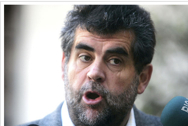
Ubilla sostuvo que comparten la decisión de Carabineros de dejar marchar a los estudiantes.