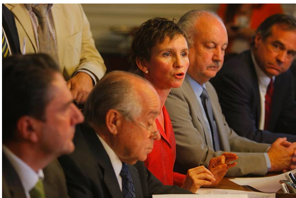
Los líderes de los partidos opositores detallaron hoy su propuesta para reformar la educación.