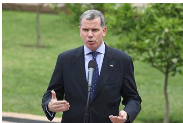
El ministro Bulnes estimó "útil e interesante" que la instancia "pueda recibir la opinión de los estudiantes".