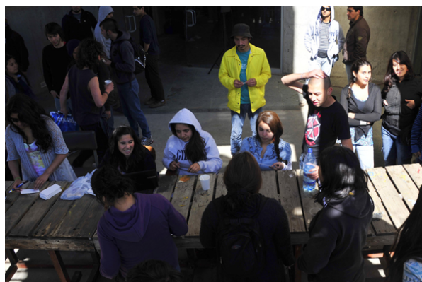
Los estudiantes organizarán además las próximas marchas convocadas para el 18 y 19 de octubre.