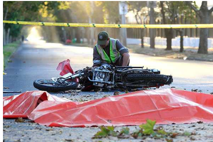
Choque entre camión y dos motos deja un menor fallecido y dos heridos en Ruta 68