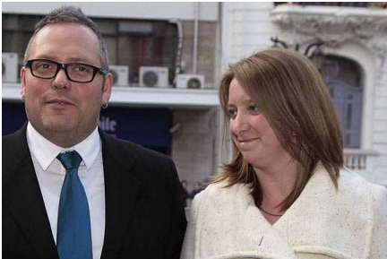
Gobierno: Sueldo de consuegra de la Presidenta "es una situación completamente regular"