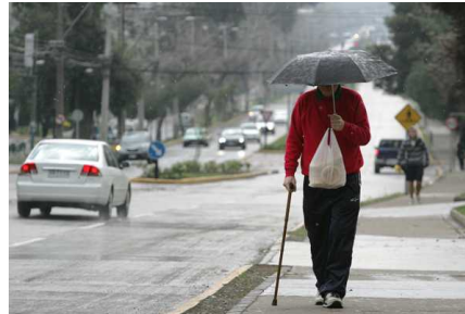
Precipitaciones afectarán mañana a la zona norte y a la Región Metropolitana