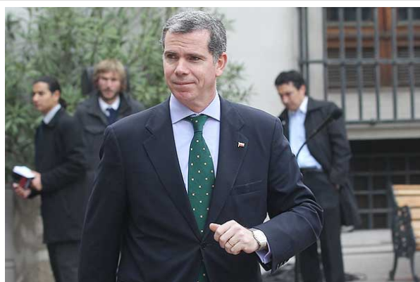
El ministro Felipe Bulnes sostuvo hoy que "el diálogo debe ser sin exigencias ni condiciones".