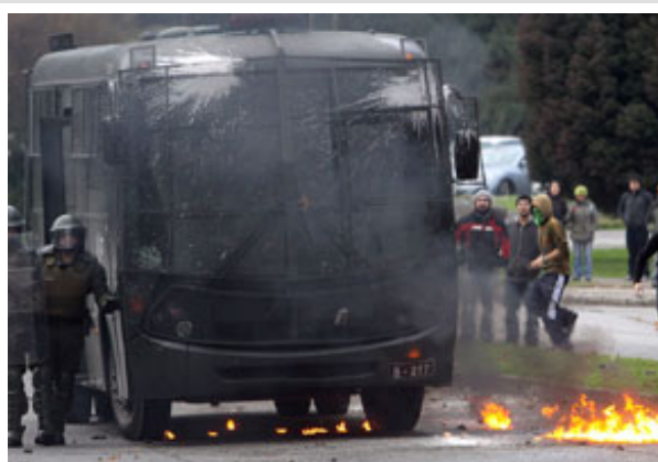
Según indicó Carabineros, fueron cerca de 500 los encapuchados que protagonizaron los desórdenes.