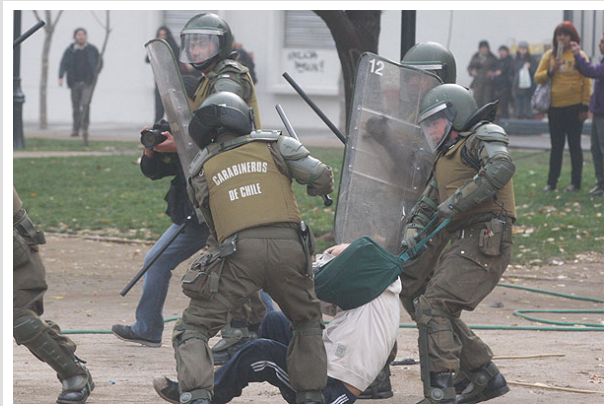
En la marcha de ayer, que no estaba autorizada por la intendencia, ocurrieron graves incidentes.

SANTIAGO.- Para impedir que se repita el habitual panorama post manifestación, en que la mayoría de los detenidos por hechos de violencia quedan libres y las querellas que presentan las autoridades no tienen mayor efecto, la Intendencia Metropolitana anunció una nueva estrategia, que implementará en la masiva marcha universitaria de hoy.