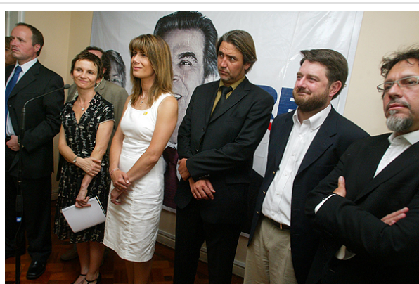
El senador Fulvio Rossi asegura que las nuevas generaciones de la Concertación están en contra de HidroAysén.