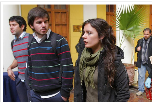
La Confech rechazó ayer dialogar con el Gobierno, que no aceptó las garantías que solicitaban.