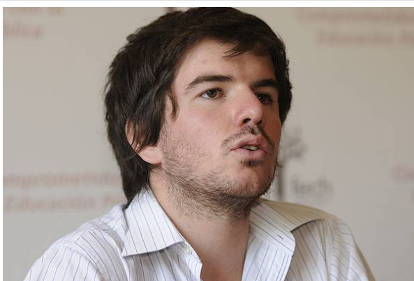
El presidente de la FEUC explicó por qué ayer no pudo participar en la vocería que dio la Confech.