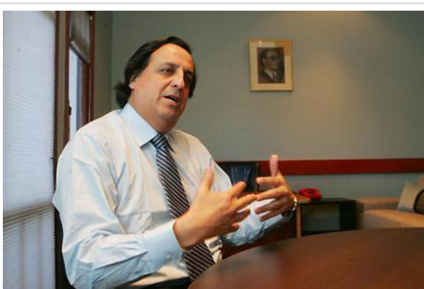
El senador afirmó que "estamos en un punto en que el problema ya ha pasado a límites poco aceptables".