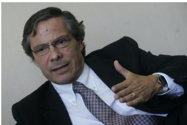
Cornejo emplazó al Ejecutivo a demostrar que está dispuesto a asumir estas demandas. De lo contrario, advirtió, la única forma de resolver esto será a través de un plebiscito.