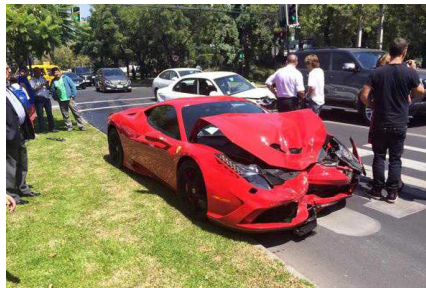
Graves daños sufrió automóvil Ferrari que protagonizó choque en Vítacura