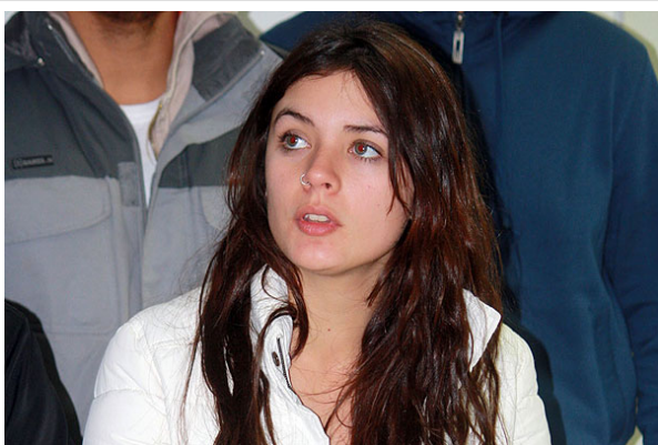
Camila Vallejo dijo que esperan que las nuevas medidas que anunciará hoy el Gobierno sean "una respuesta efectiva a nuestras demandas".