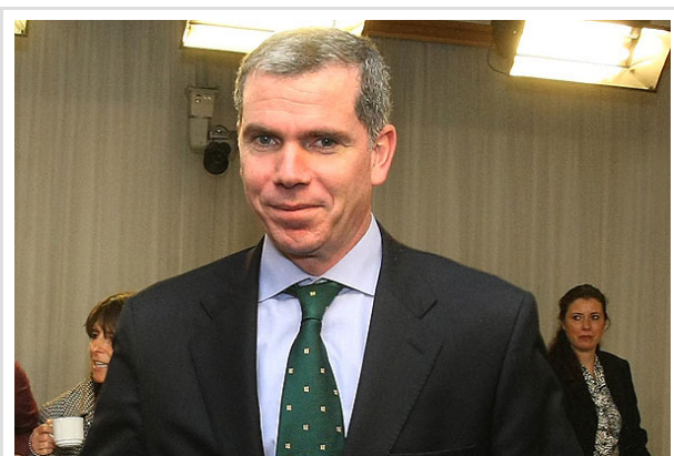
El ministro Bulnes sostuvo que "con estos ejes nos hacemos cargo de temas que están en el corazón de las movilizaciones" estudiantiles.