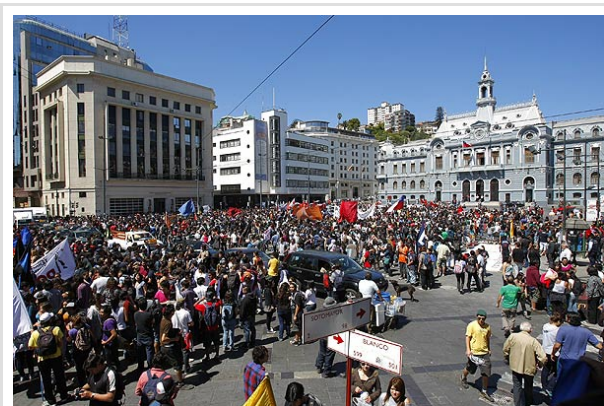
Los manifestantes se congregaron esta mañana en Plaza Sotomayor para marchar por Valparaíso.

VALPARAÍSO.- Con incidentes concluyó la marcha convocada por el Magisterio en Valparaíso, para exigir que el Gobierno transparente el proyecto de ley de desmunicipalización que, según anunció, enviará al Congreso a fines de noviembre.