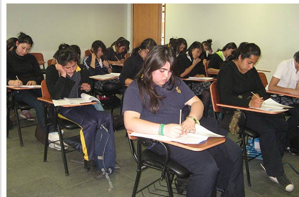
La opinión mayoritaria es que el Estado debe priorizar los recursos en la enseñanza escolar.