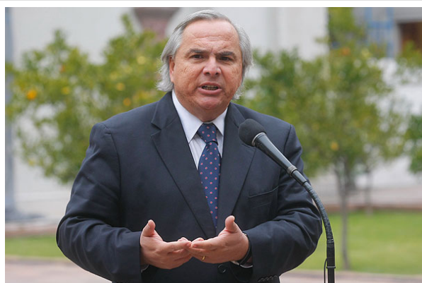
El ministro Andrés Chadwick destacó lo que se logra cuando "es posible ponerse de acuerdo".