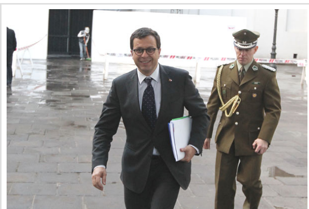
Rodrigo Hinzpeter, ministro del Interior.