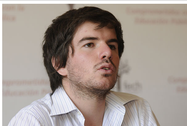
Jackson dijo esperar que los cambios "respondan a los intereses de las grandes mayorías" del país.