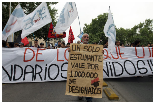
Unas 5 mil personas participaron en la marcha de este viernes, según Carabineros, aunque los organizadores hablan de 40 mil.