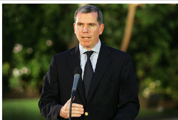
El ministro Bulnes afirmó que "no podemos darle educación superior gratuita a todos los chilenos".