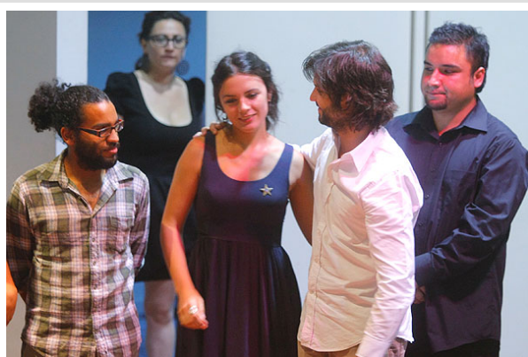
Gabriel Boric saluda a Camila Vallejo durante el traspaso de mando en la FECh.