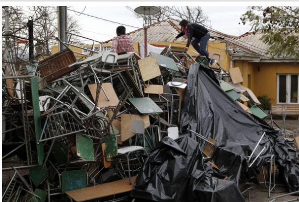
Una pila de sillas bloquea uno de los accesos al colegio.