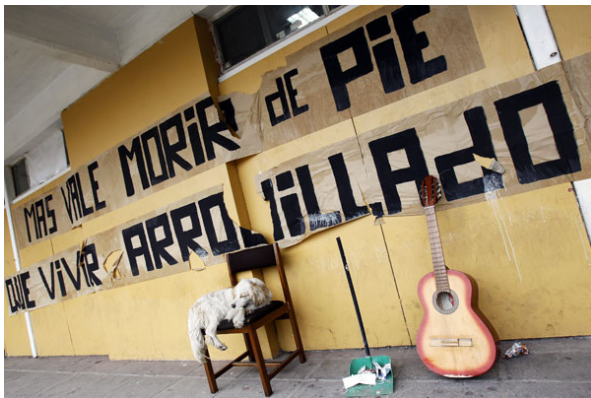
La pared de la sala que da al patio en la que permanecen los estudiantes en huelga de hambre.