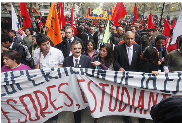
La nueva marcha convocada por los universitarios fue respaldada por el Colegio de Profesores.