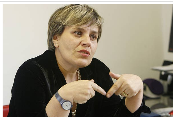
Fries dijo que es necesario que "el derecho a reunión se regule legalmente y no por decreto".