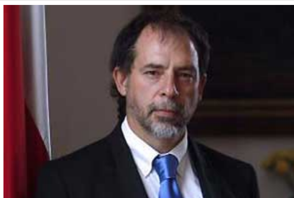
El parlamentario del PPD fue emplazado directamente por el partido concertacionista.