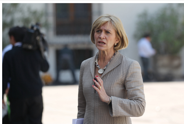
La ministra apoyó las medidas propuestas por el Gobierno para solucionar el conflicto estudiantil.