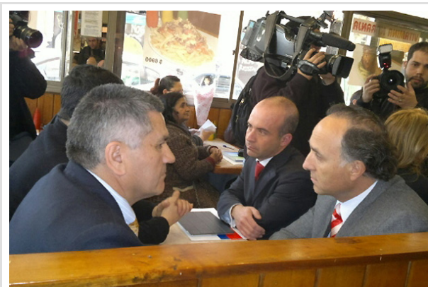
La cita del ministro con los afectados se realizó en el restaurante "Donde Zacarías", ubicado en la esquina de calle 18 con Alameda, y que también ha sido atacado.