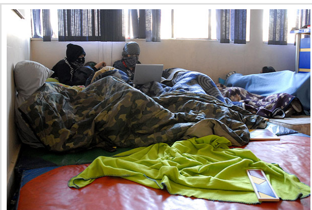
En la foto, el grupo de estudiantes que permanece en huelga de hambre dentro del liceo Darío Salas.