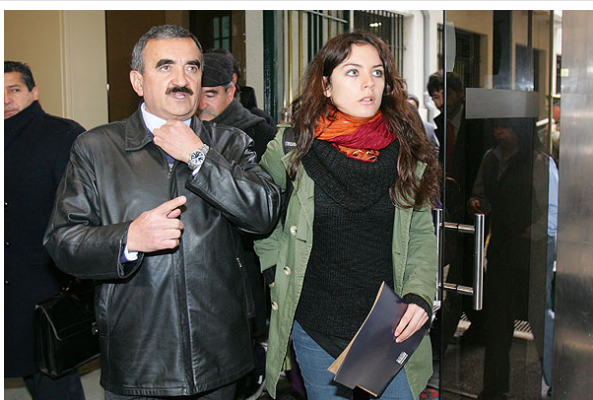
Gajardo sostuvo que el movimiento estudiantil no es sólo de los universitarios, sino también de los secundarios, de los profesores y apoderados.