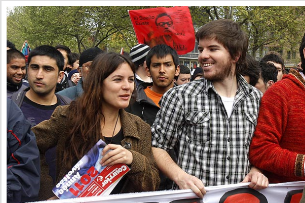
Camila Vallejo y Giorgio Jackson encabezaron la manifestación de hoy en Santiago.