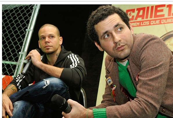
Los músicos han expresado en reiteradas oportunidades su conformidad con las demandas expuestas por los estudiantes.