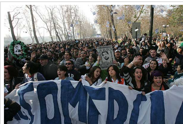
Dos años después de la revolución pingüina de 2006, secundarios y universitarios salieron a protestar por las promesas incumplidas de las autoridades de la época.