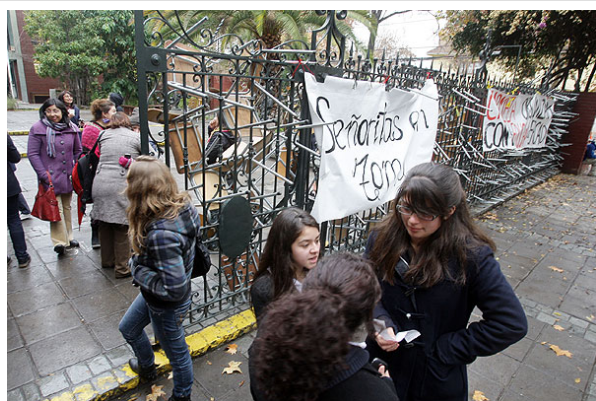
Los estudiantes secundarios se mantienen movilizados desde hace más de tres semanas.