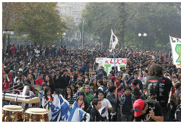
La Corpade descartó realizar la marcha el próximo fin de semana.