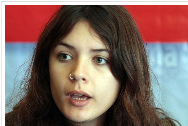
Camila Vallejo indicó que el movimiento estudiantil ha tenido éxito al "empoderar" a la ciudadanía.