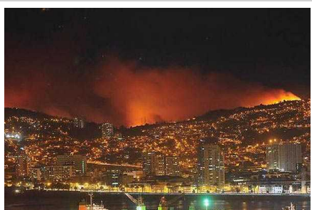
Actualización permanente: Autoridades fijan en cerca de 6.000 personas evacuadas (Fin)