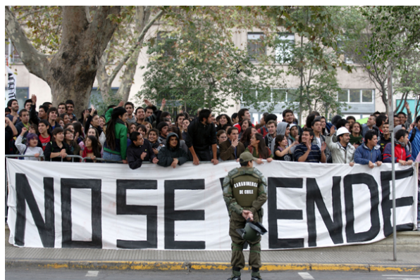
Estudiantes de la Universidad Central protestaron frente al Mineduc el pasado 12 de abril.