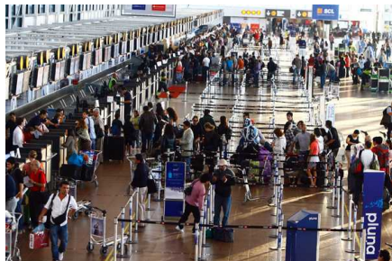
Ranking: Aeropuerto de Santiago