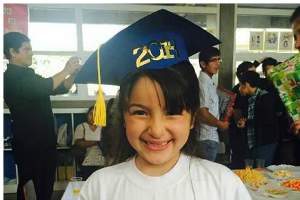
Aparece niña de seis años