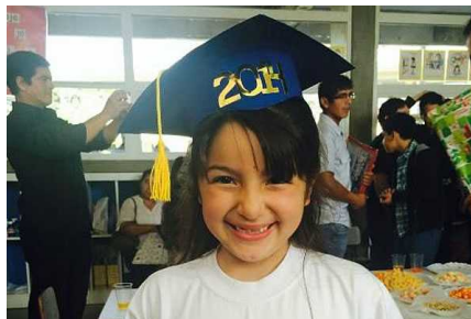
Niña de 6 años está desaparecida