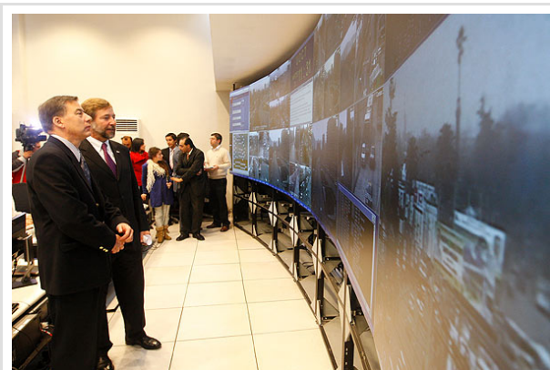
El ministro Errázuriz monitoreó el funcionamiento del sistema público de transporte durante toda la mañana.